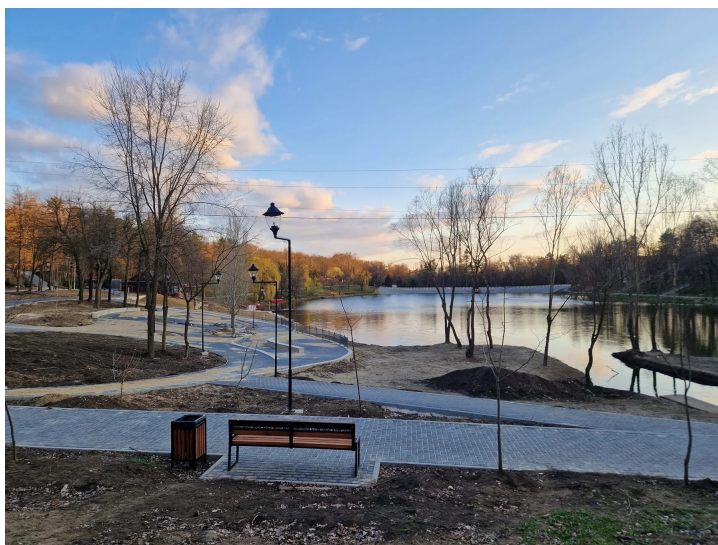
Озеро и парк: отдых у воды и созерцание.