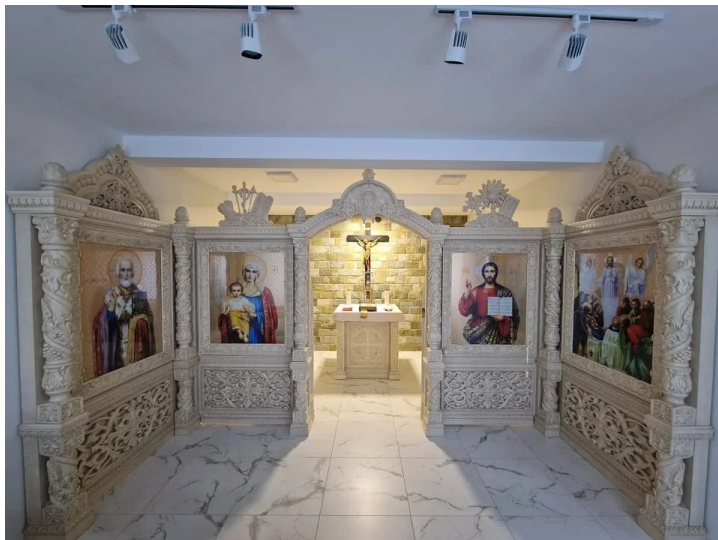
Церкви и монастыри: тишина, молитва, внутреннее восстановление.